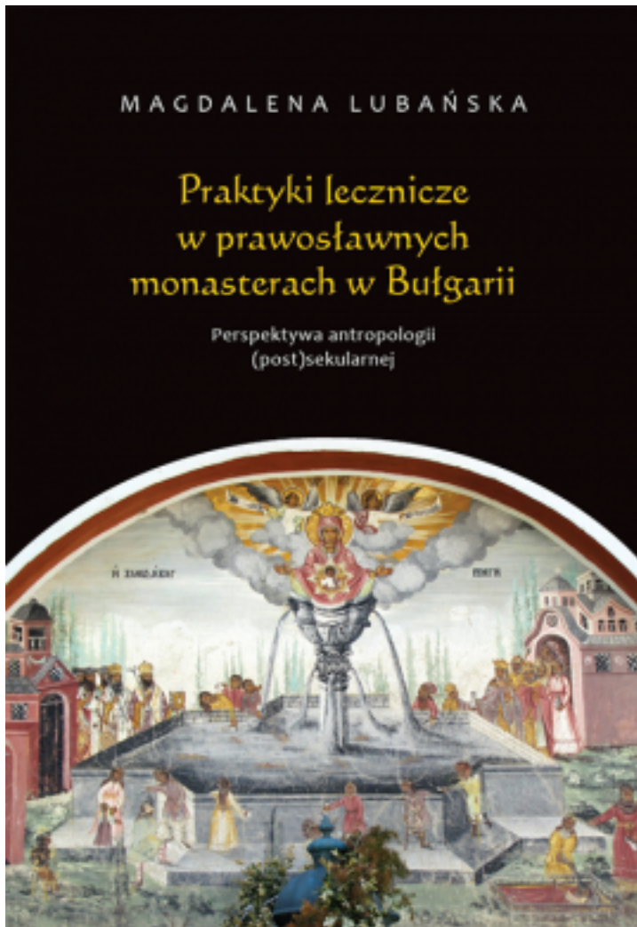
Praktyki lecznicze w prawosławnych monasterach w Bułgarii. Perspektywa antropologii (post)sekularnej, Warszawa: WUW, 2019